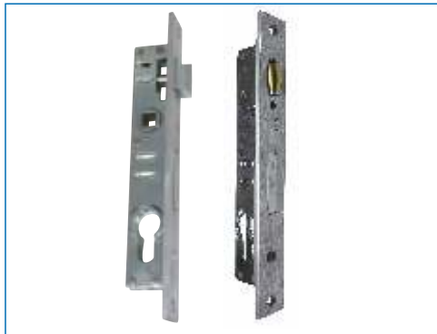
Brave za metalna vrata

Brave za drvena vrata najčešće dolaze u dvije dimenzije 6,5 cm i 8,0 cm s otvorom za cilindar, ključ ili za WC. Sve navedene modele brava proizvedene su u Hrvatskoj i dio su proizvodnog asortimana tvrtke Reta, a možete ih pronaći u Reta salonu na adresi Zagrebačka 37, Karlovac.