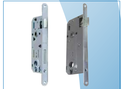
Brave za drvena vrata